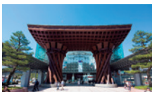
JR金沢駅(鼓門・もてなしドーム) (車・タクシーで 約5分 / バスで 約6分)