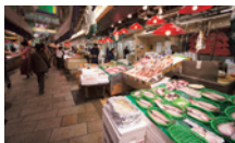
近江町市場 (徒歩 約5分)