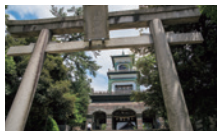
尾山神社 (徒歩 約5分)