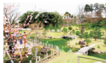
金沢城公園・玉泉院丸庭園 (徒歩 約14分)