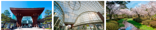
JR金沢駅(鼓門・もてなしドーム) (車・タクシーで 約5分 / バスで 約6分)