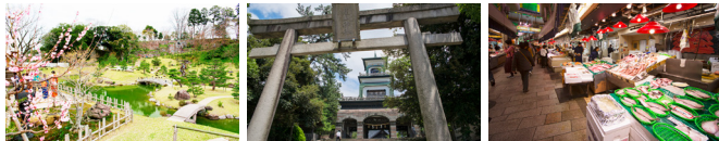
金沢城公園・玉泉院丸庭園 (徒歩 約14分)